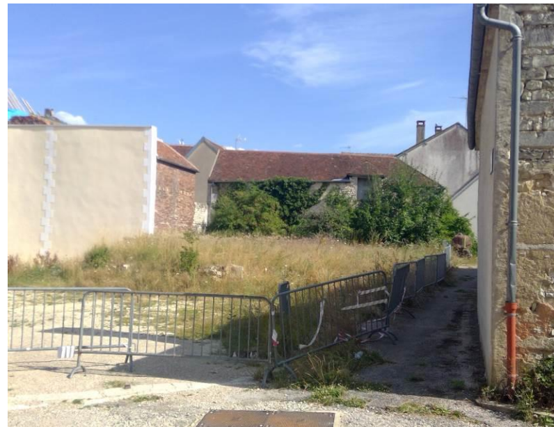
Percée visuelle sur une fermette à valoriser