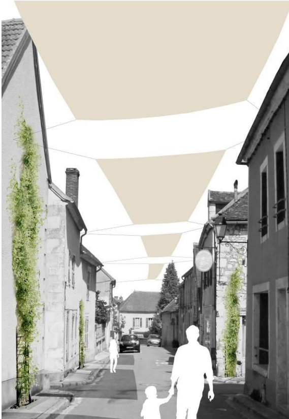
Rue Vildieu : grimpantes