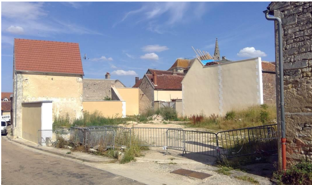
Vue depuis la rue des Dames