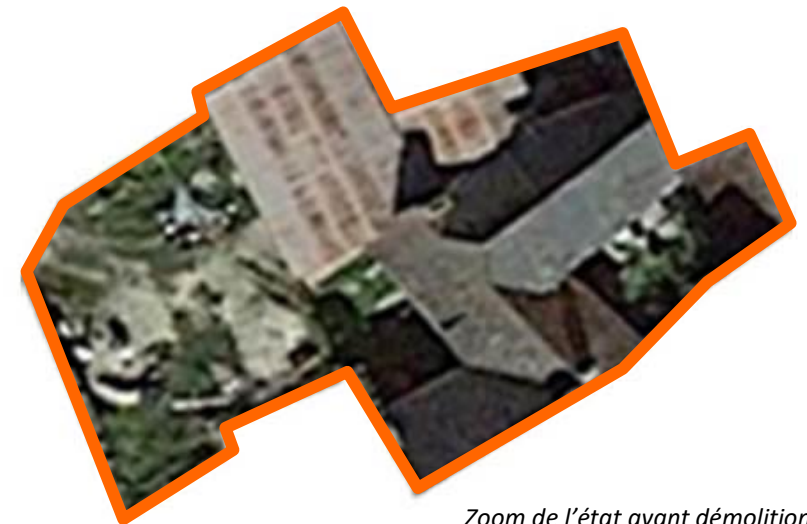
Zoom de l'état avant démolition

L'îlot Ledoux était autrefois occupé par quelques maisons insalubres et un hangar. La commune a acquis le terrain, a fait faire démolir toutes les constructions et a procédé à la sécurisation des édifices voisins (enduits murs, reprises de toitures...). L'espace aujourd'hui vacant est accessible par la ruelle de l'Equerre et par une impasse semi privative qui donne sur la place de l'ancienne poste.