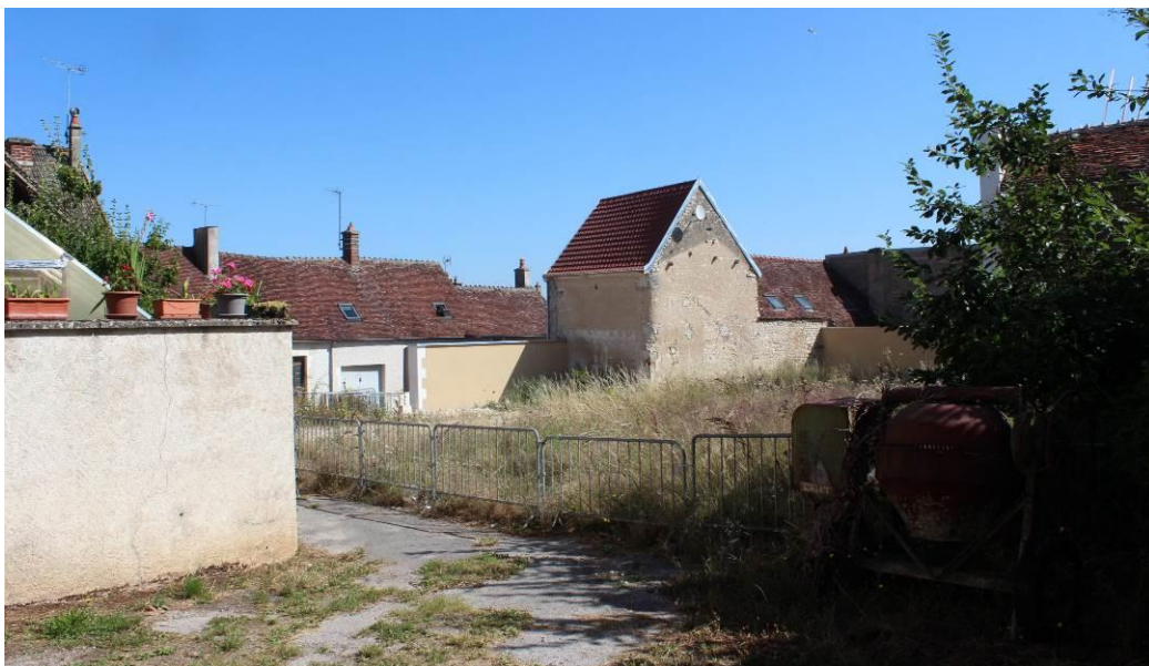
Vue depuis la ruelle de l'Equerre