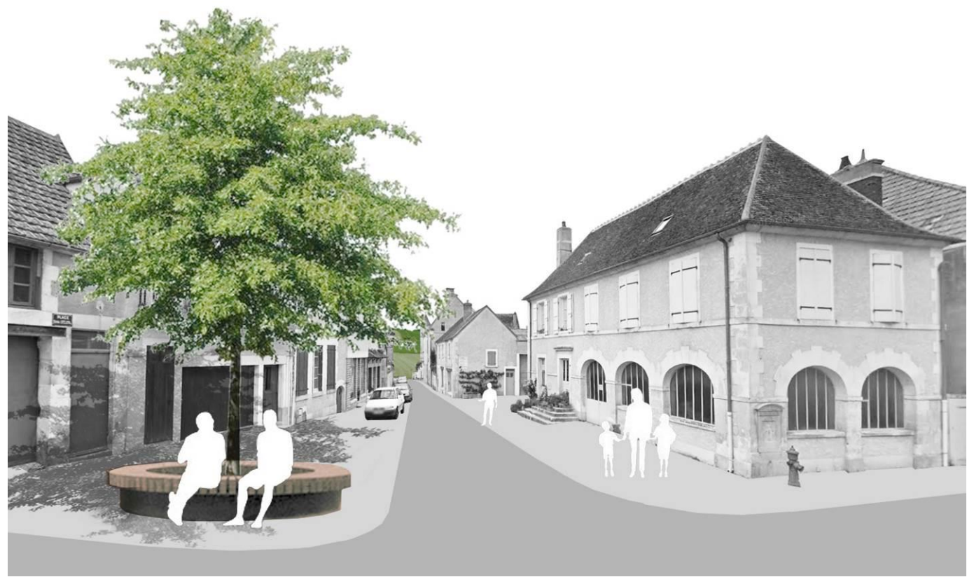
Place de l'ancienne Halle : un arbre refuge vient habiter la surlargeur.