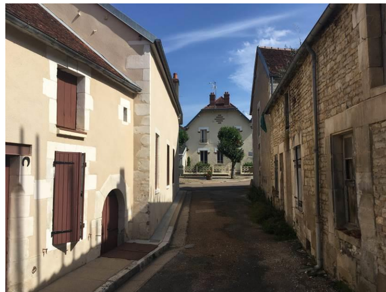
Perspective sur l'ancienne Poste depuis le fond de l'impasse