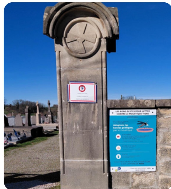
Affichage à l'entrée du cimetière