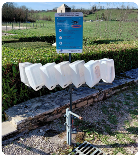
Potence à bidons/ arrosoirs (tête à l'envers)