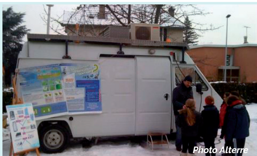
Visite pédagogique du camion de mesure d'Atmos'air par les enfants